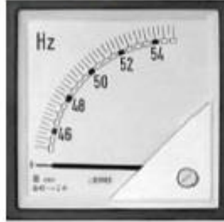
Resim 2.7 Frekansmetre Göstergesi

Frekansmetre Göstergesi aşağıda gösterilmiştir (Resim 2.7).