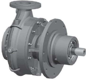
Şekil 1.18 - Deniz Suyu Tulumbası

KULLANILDIĞI SİSTEM CİHAZ GEMİ ADI: DENİZDE İKMAL DESTEK GEMİLERİNDE KULLANILACAKTIR